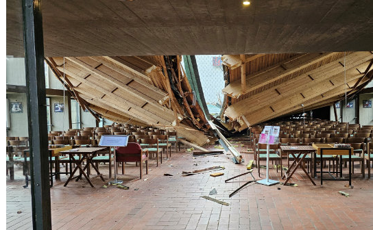
Elisabethkirche nach dem Dacheinsturz